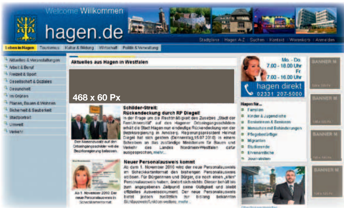
Banner 120 x 125 Position 1