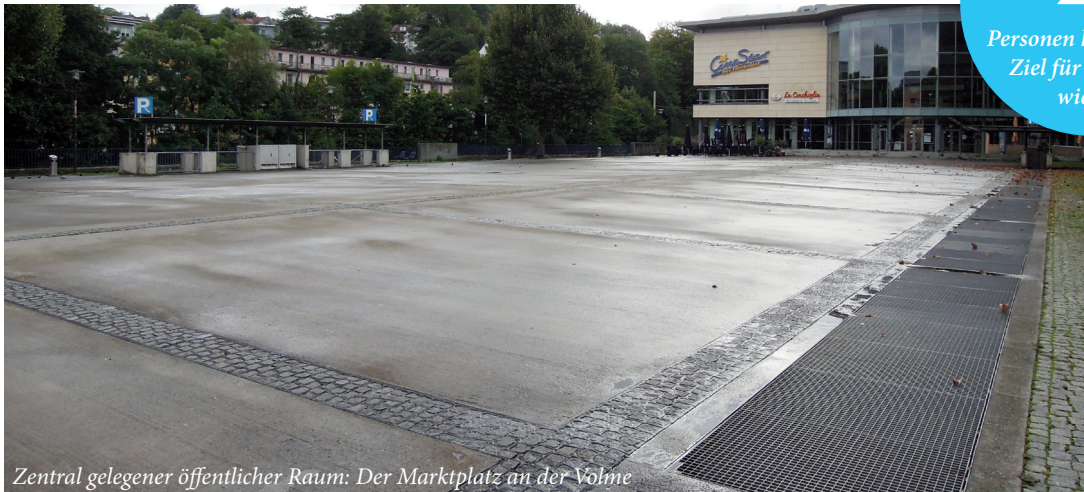
Zentral gelegener öffentlicher Raum: Der Marktplatz an der Volme

Personen halten dieses Ziel für besonders wichtig!