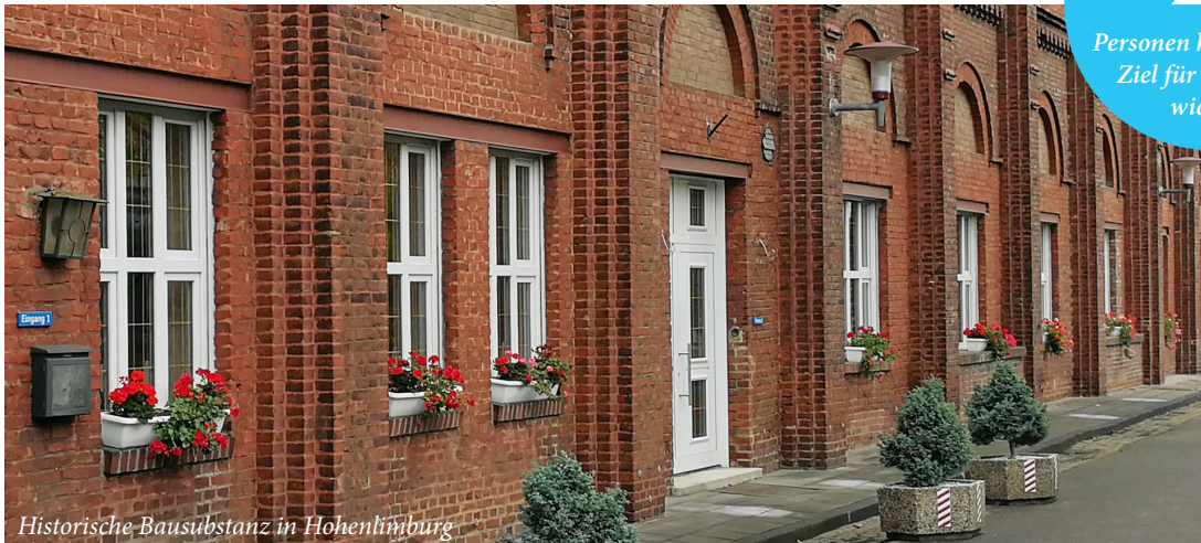
Historische Bausubstanz in Hohenlimburg

Personen halten dieses Ziel für besonders wichtig!