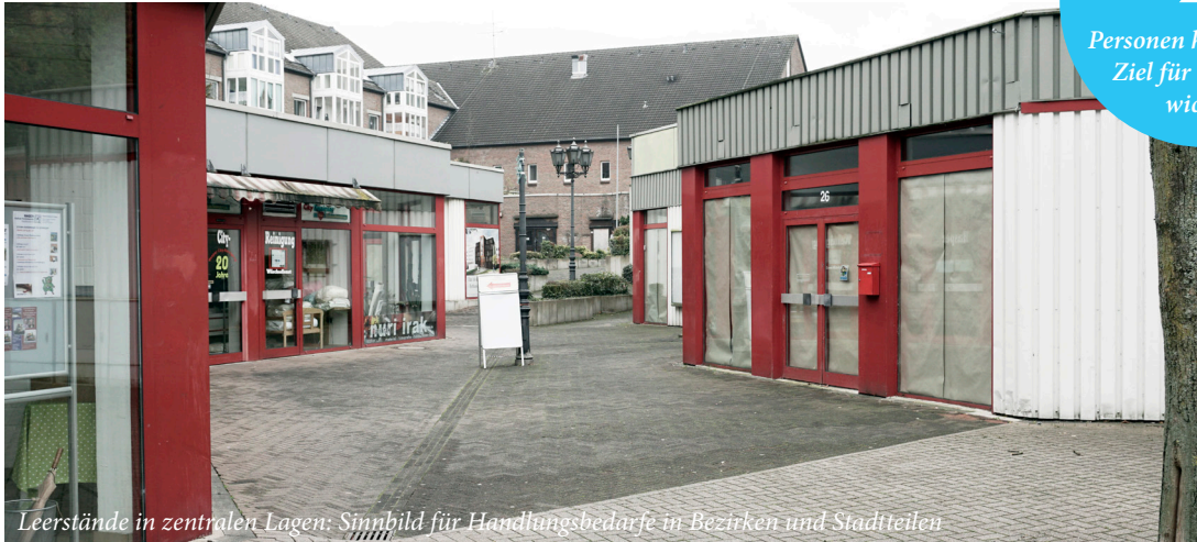
Leerstände in zentralen Lagen: Sinnbild für Handlungsbedarfe in Bezirken und Stadtteilen