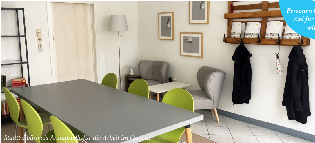
Stadtteilbüro als Anlaufstelle für die Arbeit im Quartier

Personen halten dieses Ziel für besonders wichtig!