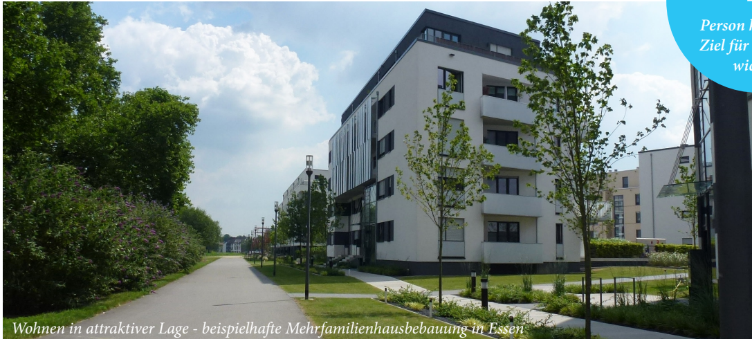
Wohnen in attraktiver Lage - beispielhafte Mehrfamilienhausbebauung in Essen

Person hält dieses Ziel für besonders wichtig!