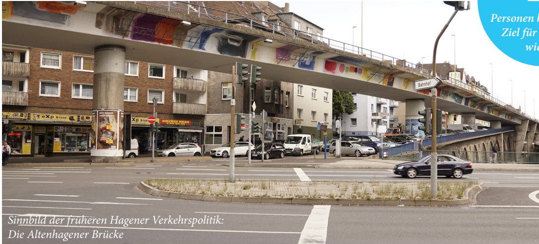
Sinnbild der früheren Hager Verkehrs politik: Die Altenhagener Brücke

Personen halten dieses Ziel für besonders wichtig!