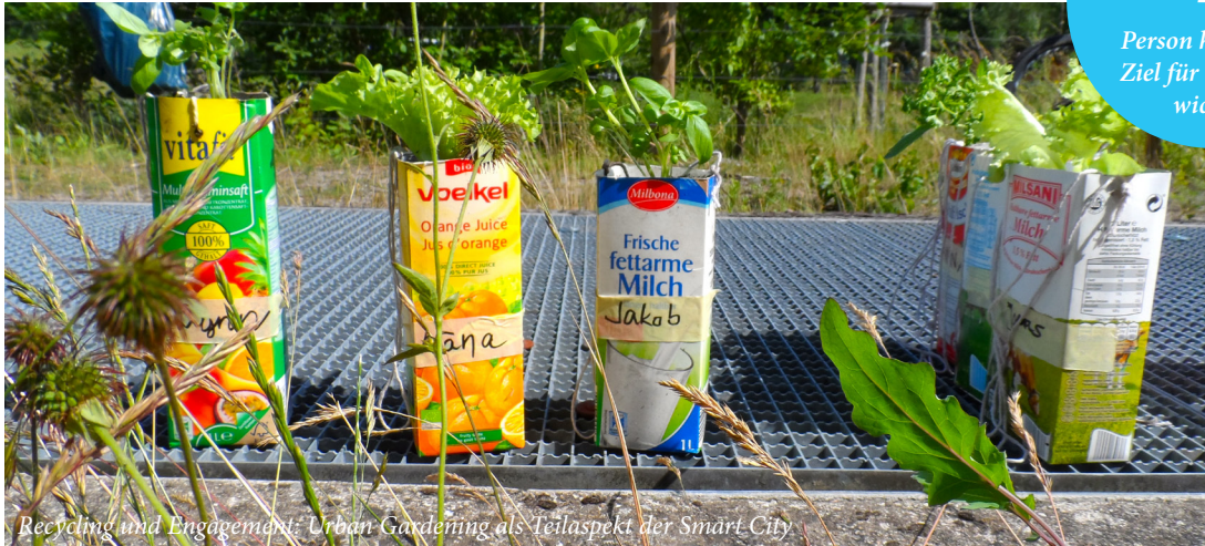
Recycling und Engagement: Urban Gardening als Teilaspekt der Smart City