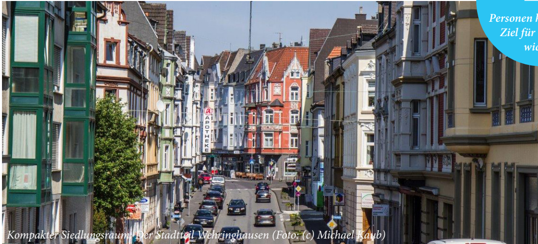
Kompakter Siedlungsraum: Der Stadtteil Wehringhausen

Personen halten dieses Ziel für besonders wichtig!