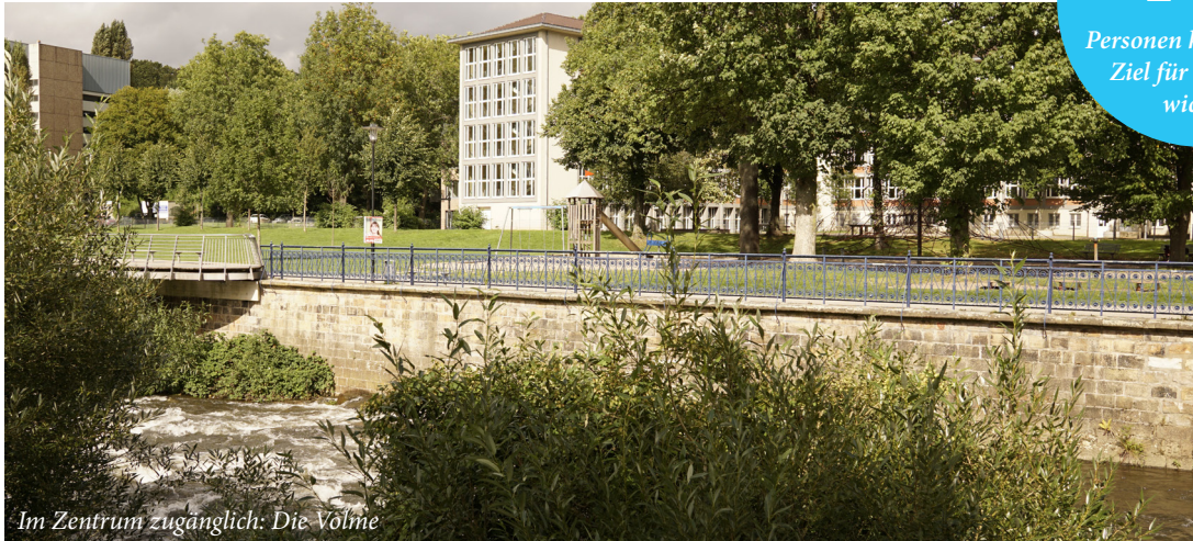
Im Zentrum zugänglich: Die Volme

Personen halten dieses Ziel für besonders wichtig!