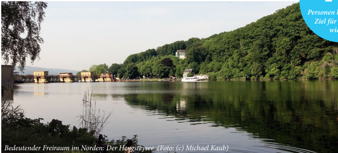
Bedeutender Freiraum im Norden: Der Hengsteysee.

Personen halten dieses Ziel für besonders wichtig!