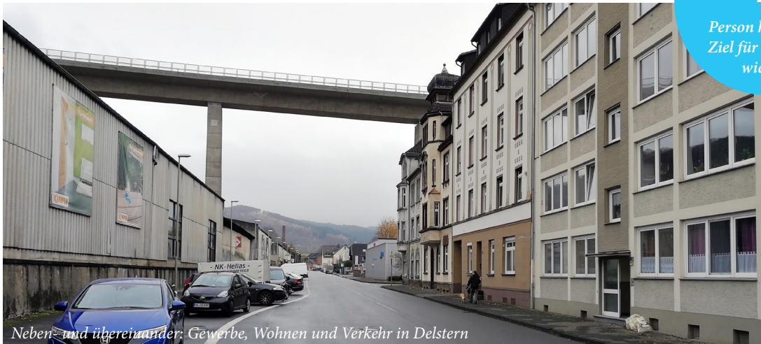
Neben- und übereinander: Gewerbe, Wohnen und Verkehr in Delstern

Person hält dieses Ziel für besonders wichtig!