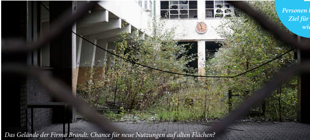
Das Gelände der Firma Brandt: Chance für neue Nutzungen auf alten Flächen?