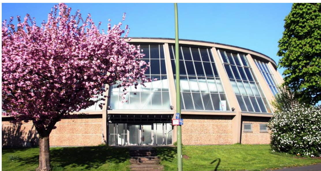
Elseyer Rundturnhalle