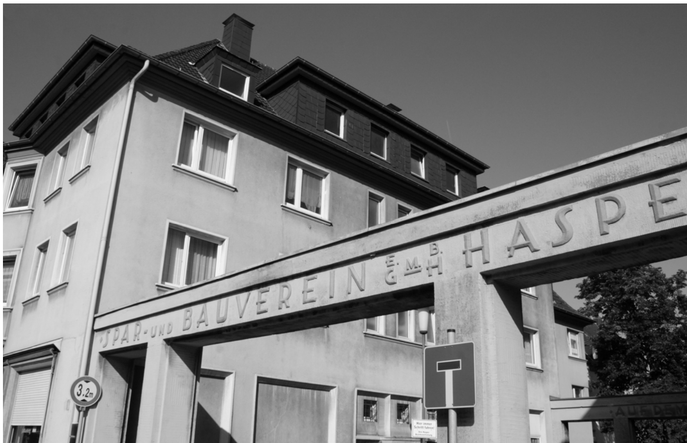
Siedlung auf dem Steinbrink im Hagener Stadtteil Haspe.