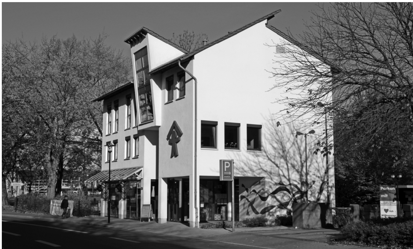
Das „Haus für Kinder“ des Hagener Kinderschutzbundes im Ferdinand-David-Park.