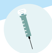
захисне щеплення від коронавірусу

Більше інформації на сайті corona-schutzimpfung.de