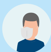
будні з маскою